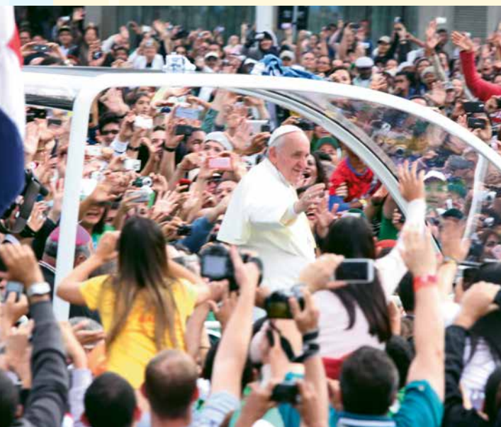
In copertina: Statue bronzee dei Servi di Dio Casa Generalizia - Napoli

L'Apostolo Paolo ci offre una visione molto profonda della centralità di Gesù. Ce lo presenta come il Primogenito di tutta la creazione : in Lui, per mezzo di Lui e in vista di Lui furono create tutte le cose. Egli è il centro di tutte le cose, è il principio: Gesù Cristo, il Signore. Dio ha dato a Lui la pienezza, la totalità, perché in Lui siano riconciliate tutte le cose (cfr Col 1,12-20). Signore della creazione, Signore della riconciliazione.